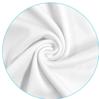
A | Single jersey polyester