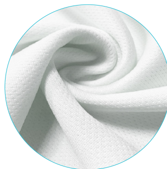
C | Coolmax® micro bird eye