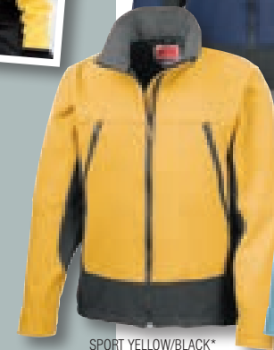
SPORT YELLOW/BLACK* (122/BLK)