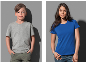
ST2220 Classic-T Organic Kids