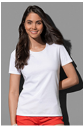
ST7600 Lux Fitted